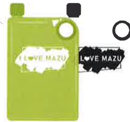
愛媽祖 A5 潮流水壺 (兩款顏色選擇)